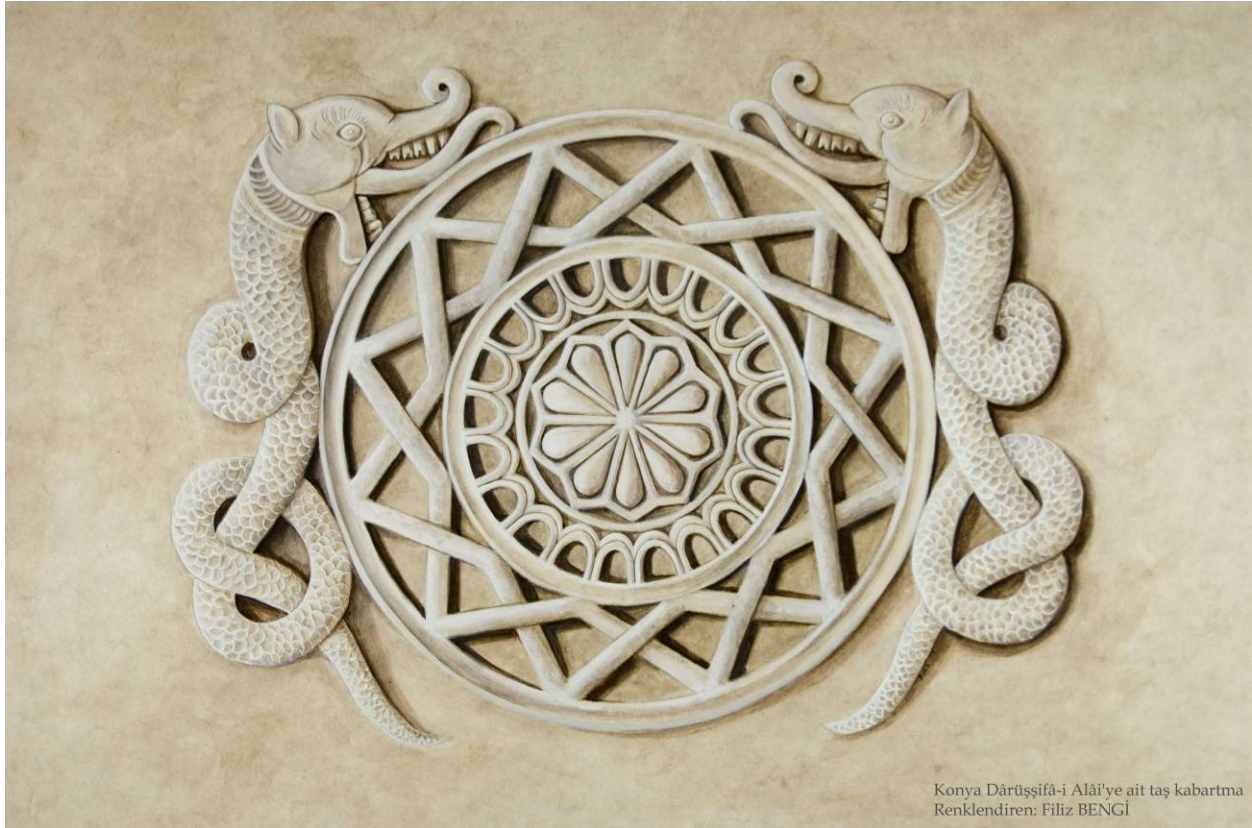
Konya Dârüşşifâ-i Alâi'ye ait taş kabartma Renklendiren: Filiz BENGİ

20 – 24 Mayıs 2008 / 20 – 24 May, 2008 KONYA – TÜRKİYE (TURKEY)